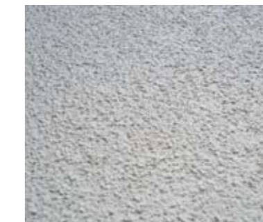
FINITURA GRANA MEDIA MEDIUM GRAIN FINISH

On request, the product can be supplied with different types of finishing.