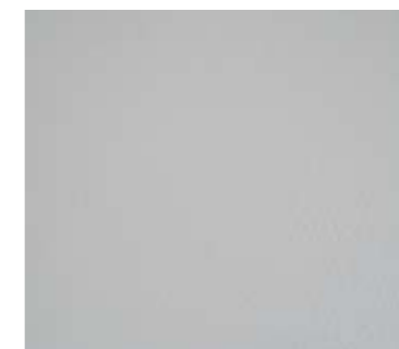
FINITURA LISCIA SMOOTH FINISH

A richiesta il prodotto può essere fornito con diverse tipologie di finitura.