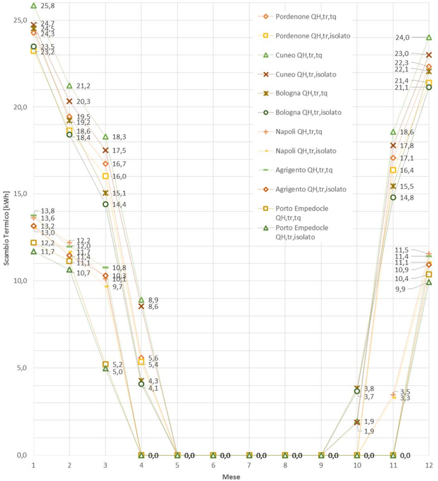
Figura 2. Scambio termico per trasmissione nel caso di riscaldamento in kWh